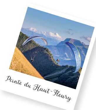
Pic du Haut-Fleury