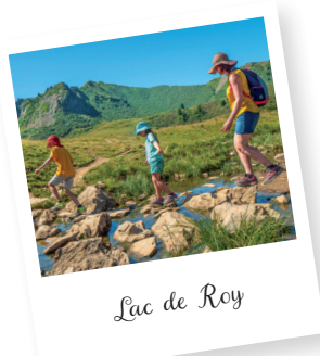
Lac de Roy